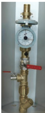
COMPTEUR MANUEL CMS